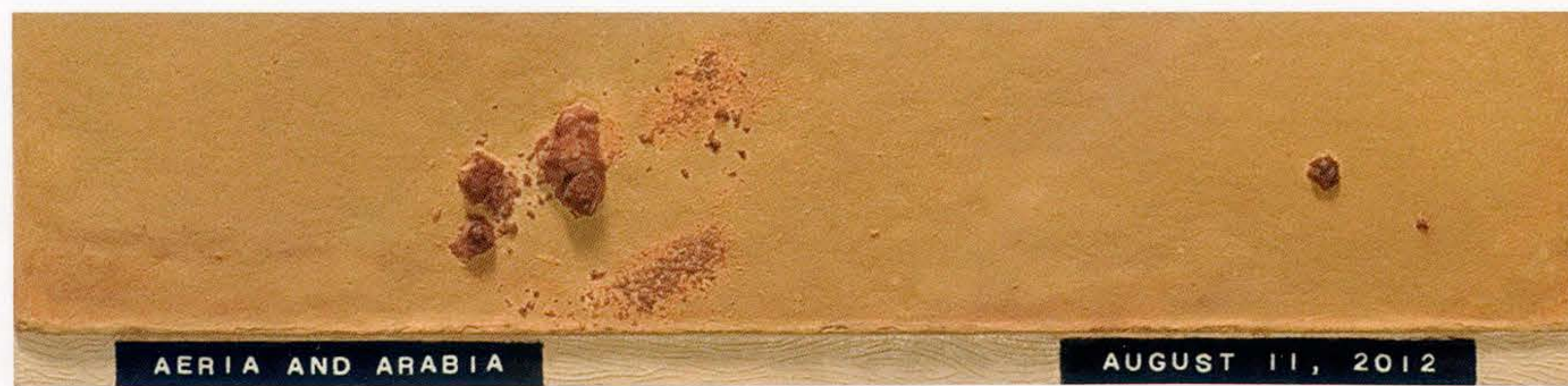
© Julião Sarmento. Courtesy of Mixografra, LA